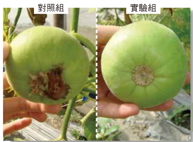
實驗組：蒂頭完整 對照組：害蟲侵蝕、腐爛